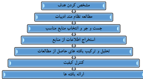
شکل ۱. مراحل هفت گانه شیوه فراترکیب