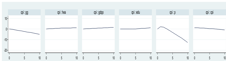
شکل ۲. نتایج توابع عکس‌العمل مدل مورد بررسی

زمان‌بندی اثر تکانه‌ها است. به‌منظور ترسیم نحوه حرکت زمانی سیستم پس از وارد کردن شوک و تفکیک رفتار هر یک از متغیرهای الگو پس از شوک، از روش ضربه‌های تعمیم‌یافته استفاده شده است. در این روش، با تغییر رتبه‌بندی متغیرهای الگو، نتایج عکس‌العمل برآوردشده تغییری نمی‌کند. شکل (۲) فرم تابع عکس‌العمل آنی متغیر فساد را در مقابل شوک‌های واردشده به اندازه یک انحراف معیار از سوی متغیرهای الگو را نشان می‌دهد.