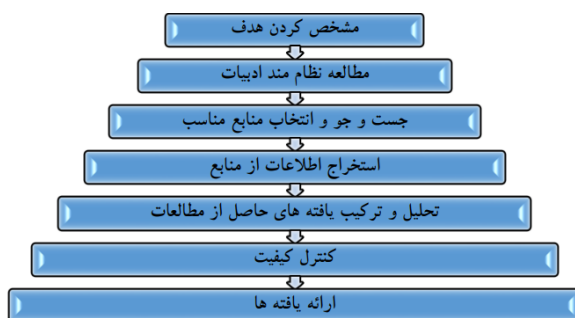
شکل ۱. مراحل هفت گانه شیوه فراترکیب