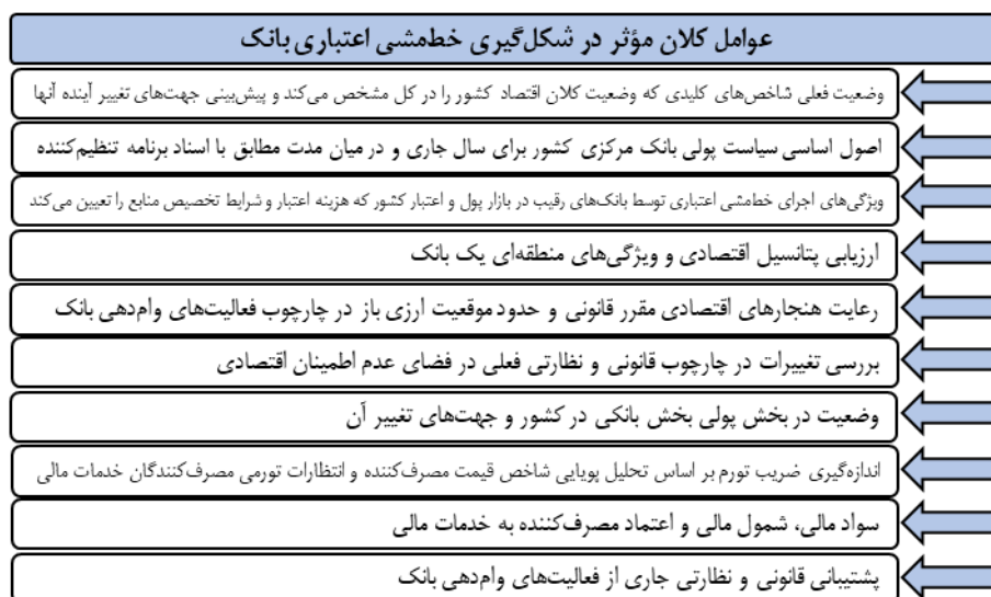
شکل ۳. عوامل خرد مؤثر در شکل‌گیری خطمشی اعتباری بانک