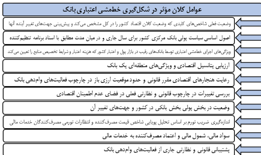
شکل ۲. عوامل کلان مؤثر در شکل‌گیری خط‌مشی اعتباری بانک