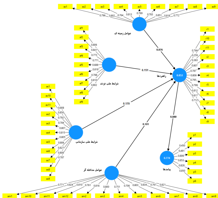
برازش مدل تحقیق (ضرایب مسیر- خروجی نرم افزار)